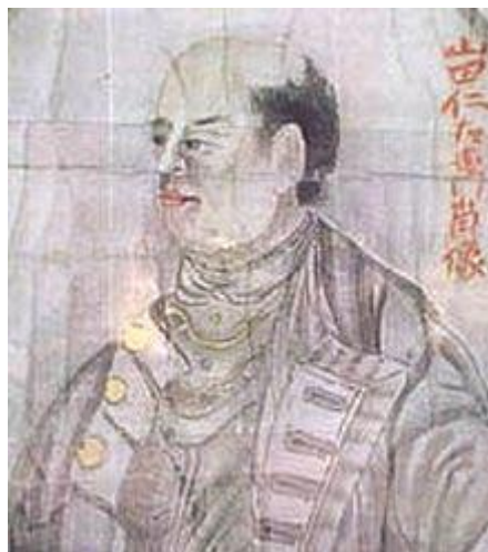
ยามาตะ นางามาซะ

6.ครูให้นักศึกษาดูภาพ ด้านล่างแล้วตอบว่าเขาคือใคร จากนั้นอธิบายความสัมพันธ์กับต่างประเทศสมัยอยุธยา