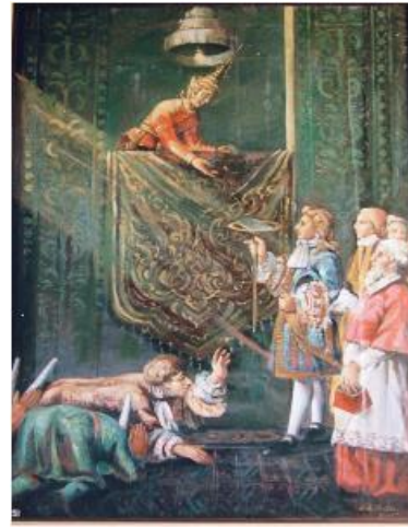
ฝรั่งเศส

2.ครูถามนักศึกษาว่านักศึกษารู้จักความสัมพันธ์กับต่างประเทศของประเทศไทยกับประเทศใดบ้าง ครูเขียนไว้บนกระดาน