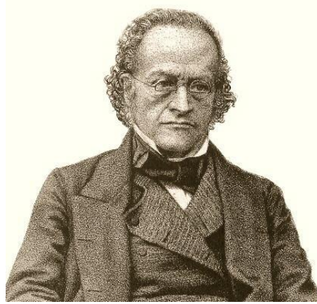
เซอร์จอห์น เบาริง

9.ครูให้นักศึกษาดูภาพ ด้านล่างแล้วตอบว่าเขาคือใคร จากนั้นอธิบายความสัมพันธ์กับต่างประเทศ สมัยรัตนโกสินทร์