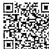
ทุนวิจัยและนวัตกรรม

กองบริหารแผนและงบประมาณการวิจัย โทร. ๐ ๒๕๖๑ ๒๔๔๕ ต่อ ๔๐๖ - ๔๐๘, ๔๑๐, ๔๑๕ โทรสาร ๐ ๒๕๔๐ ๕๔๙๕ ไปรษณีย์อิเล็กทรอนิกส์ graduate.nrct@nrct.go.th