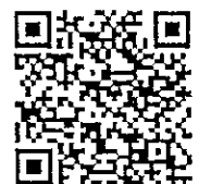
ทุนพัฒนาบุคลากร